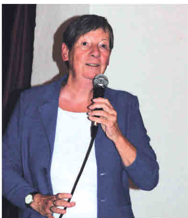
Dr. Barbara Hendricks im Sudhaus